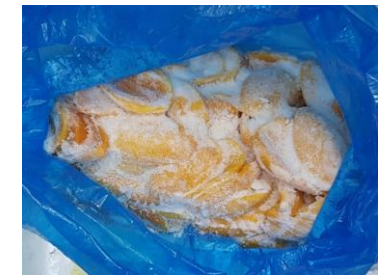
Xoài cắt miếng đông lạnh