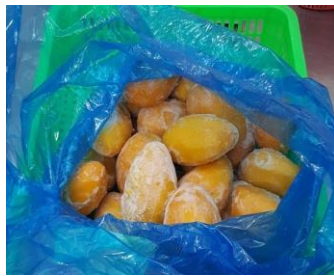
Xoài gọt vỏ nguyên trái đông lạnh